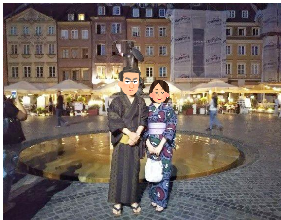
《ワルシャワ旧市街広場》

また、着付けを習い始めたおかげで、旅行の楽しみが増えました。一昨年以来、夫と行く夏の海外旅行には、夫婦二人の浴衣を持参するようになりました。