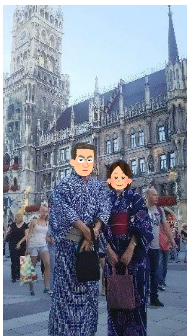
《ミュンヘン市庁舎》

一昨年はドイツのミュンヘン、昨年はフィンランドのヘルシンキ今年はポーランドのワルシャワで浴衣を着ました。東欧北欧の夏の夕方は気温が24度ぐらいで浴衣にぴったりの気温になります。また白夜で日没が午後九時半頃と遅く、夕飯の後薄暮のそぞろ歩きで浴衣を存分に楽しむことができました。