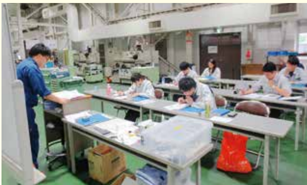
昨年のものでづくり体験の様子

▽ ものづくり体験 ＝組合員向けにポリテクセンター関西（大阪府摂津市）において、6月中・下旬に行う予定です。6月17日（水）～19日（金）と6月24日（水）～26日（金）の各3日間の日程となり、それぞれで旋盤コースとフライス盤コースを設定しています。1人1台の旋盤またはフライス盤が与えられ、指導者からの指導を受けながら、課題に基づいて3日間で1つの製品を作り上げます。こうした加工体験を通じて実践的な知識と技能を学び、取扱商品の理解に繋げて、機械器具・工具のセールスのレベルアップに役立ててもらおう施策です。